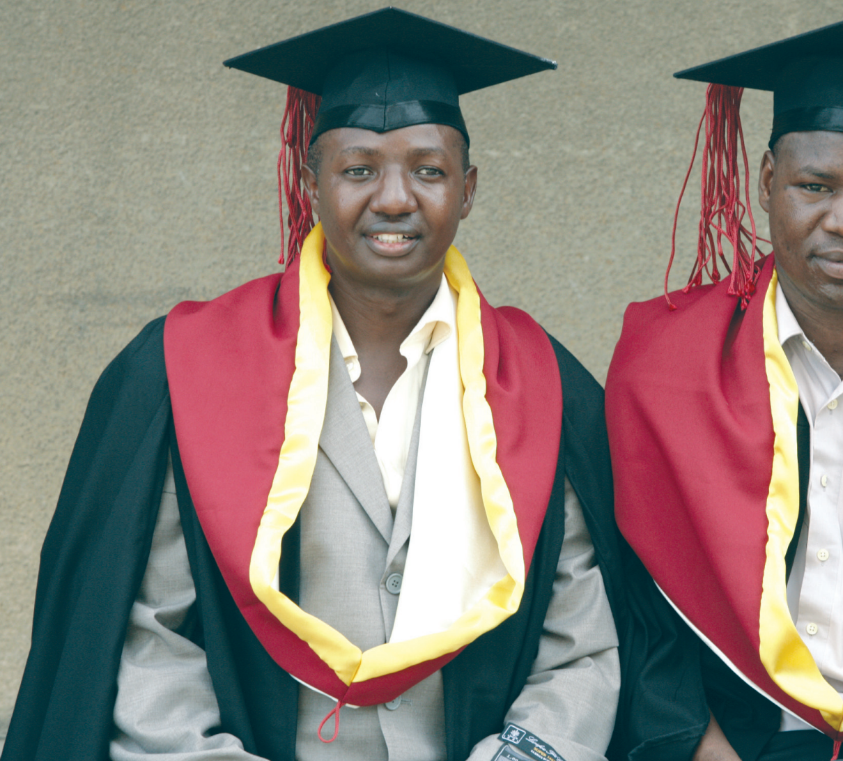
Végzett egyetemisták a Dar es-Salaam-i Egyetemen, 2006 - Maradnak - elmennek?

lások csupán nagyjából 15%-át teszik ki, a kivándoroltak jövedelmeinek ezen hazaküldött részei összesítve sok esetben önmagában értelmezhető gazdasági hatást képvisel. A számokat vizsgálva, és néhány leginkább érintett afrikai államot példaként hozva, a 2002–2007/08 közötti időszakban markáns változásokra figyelhetünk fel. Nigéria esetében a hazautalások volumene 2002-ben 1300 millió USD körül moz-