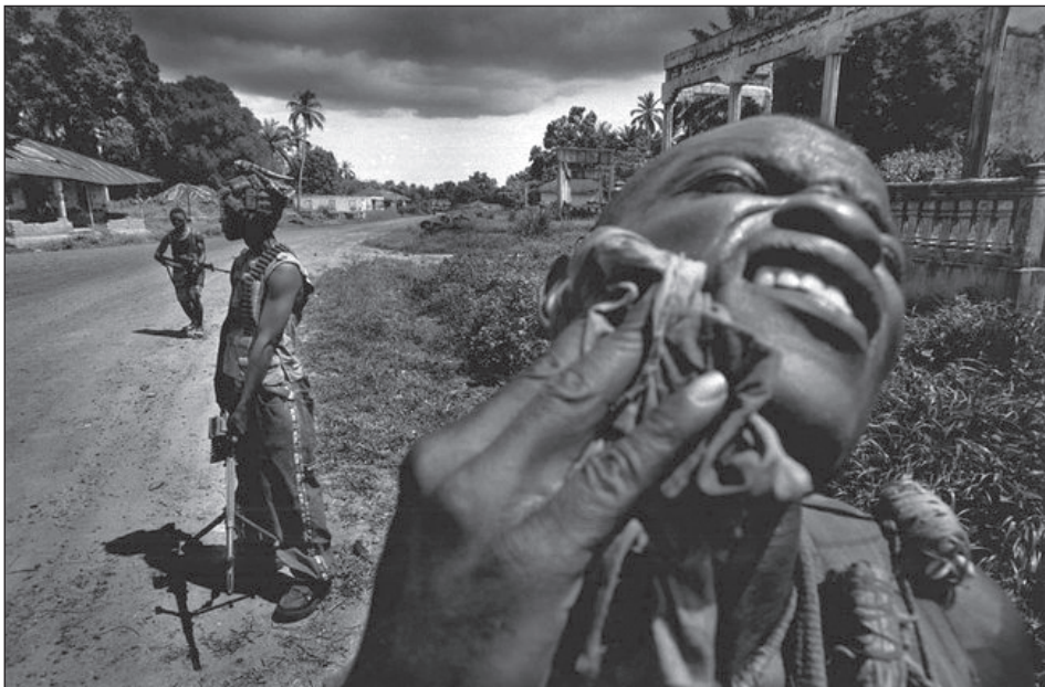
Férlúton Freetown felé.

hajtott végre beavatási szertartásokat. Ezen a beavatáson az új tagok megkapták a Kamajort hírhedt tévő állítólagos varázserőt, amelynek segítségével hitük szerint akár a golyó is lepatan róluk vagy tisztán látnak a sötétben, továbbá magukévá tették a szabályokat, amelyeknek be nem tartása a varázserő elvesztését és súlyos büntetést, akár halált is vonhatott maga után – bár míg előbbi a morál javítása miatt volt fontos, utóbbi inkább a kétes elemek távolytartására szolgált. A főként családjaik, rokonaik elvesztése miatt érzett bosszúvágyból és a közösségük védelme érdekében fegyvert ragadó kamajorok annyira mélyen hittek varázslatos erejükben, hogy egyes Kamajor egységek, mint például a „Born Naked” néven elhíresült csoportosulás, meztelenül indult harcba.