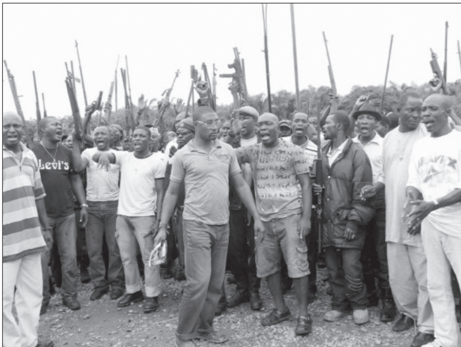
A Bakassi sokak számára kitörési lehetőség volt.

dők összefogtak és összecsaptak a területet uraló bűnözőkkel. A csoportok tevékenysége végül nem is ott lett a legjelentősebb, mert később a legerősebb ilyen csoportok az ún. Igbo régióban, azon belül is Abia és Anambra államban jöttek létre. Kezdetben a legmagasabb hatósági szintek nem hivatalos támogatásával küzdöttek a bűnözés ellen. A Bakassi Fiúk szinte kizárólag fiatalokból állnak, akik lőfegyverekkel, bozót- vágókkal felszerelve törvényeket figyelmen kívül hagyva brutális leszámolásokat hajtanak végre bűnözői csoportok tagjai ellen. Hatékonyságuk annyira jelentős volt, hogy más Igbo államokba is meghívták őket, ahol szintén jelentős eredményeket értek el rövid idő alatt, azonban a politikai szelek irányá vál-