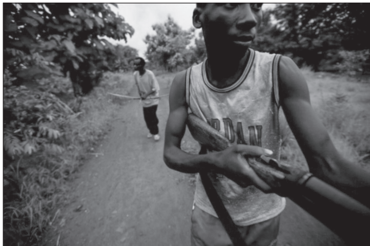
Michael Jordan is az LRA nyomában.

tüntetésen igyekeztek vallási vezetők, politikusok és a nyugat-egyenlítői tartomány kormányzója az LRA elleni harc fontosságára felhívni a figyelmet) a dél-szudáni kormányzat fokozatosan egyre szorosabbra fonta kapcsolatát a milíciával és még egy fegyverbeszolgáltatási kampányt is felfüggesztett annak érdekében, hogy a polgárok megvédhessék magukat a brutális támadásoktól.