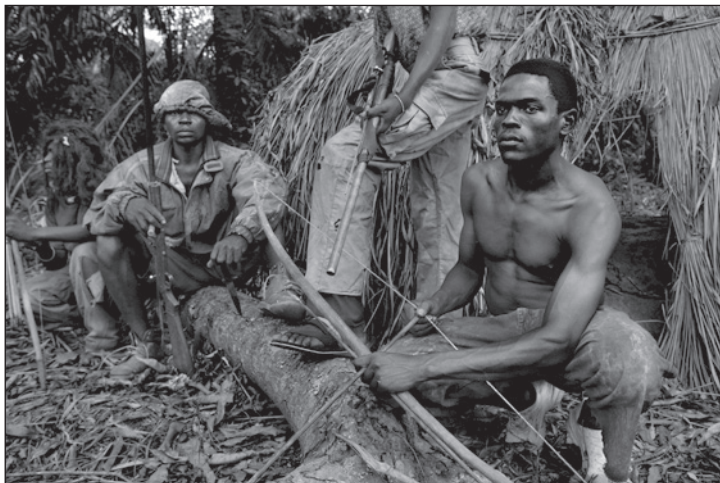
Harcosok Nzarában, az elmaradhatatlan íjjal.

egy, a tízparancsolat szerint élő Uganda létrejöttét vizionáló Joseph Kony által vezetett LRA egész Közép-Afrika életét keseríti már több mint két évtizede: falvak elleni támadások a Kongói Demokratikus Köztársaságban, gyilkosságok a Közép-afrikai Köztársaságban, gyerkekek elrablása Ugandában, nemi erőszak, fosztogatás, gyújtogatás Dél-Szudánban – csak néhány szörnyűség az Afrika rossz hírére keltő örültek számlájáról. Az érintett országok többször, több módszerrel próbáltak leszámolni a ma már terroristacsoportként nyilvánított szervezettel, mindeddig sikertelenül. A legutolsó ilyen akció még 2008-ban, az Egyesült Államok támogatásával valósult meg, és bár a Mennydörgő Vihar okozott károkat, célját nem érte el, az LRA a mai napig létezik és kísérti Dél-Szudán lakóit is. Gyilkosságokat, csonkolásokat követtek el, gyermekeket raboltak el, a fiúkat szolgálknak és jövőbeni harcosoknak, a lányokat pedig szexrabszolgáknak és házi-