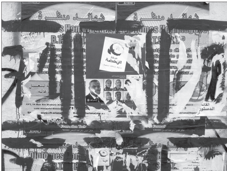
Választási plakátok Tunéziában (2011).

Londonban élő milliárdos üzletember, a populista-demagóg iszlamista, Ben Ali elnök volt szövetségese, Hachemi Hamdi „Népi petíciója”, amely 26 képviselői helyhez jutott. A választási előjelzések szerint második helyre várt, Ahmed Néjib Chebbi elnökölte Haladó Demokrata Párt csupán 16 mandátumhoz jutott 8 .