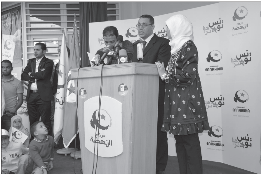
Az En-Nahda vezető tisztségviselői a választásokat követő sajtótájékoztatón

Már a választási kampány idején sokan tették fel a kérdést Tunéziában és külföldön, s így Franciaországban: fennáll-e az iszlamista fordulat veszélye? A kérdésfeltevés nem volt alaptalan. Így például zavart, döbbenetet és felháboro-