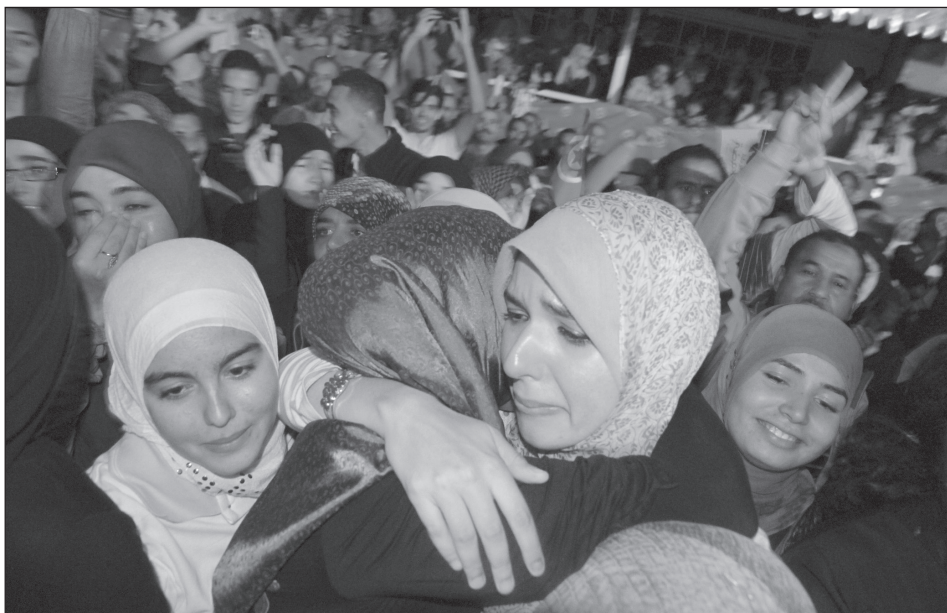
Az En-Nahda hívei a párt győzelmét ünneplik Tuniszban.

sem identitásbeli, sem vallási problémája nincs. Nem egy iszlamista pártra van szükségünk, hanem fejlődésre politikai, társadalmi és gazdasági területen... De ami tény, az tény: az En-Nahda megnyerte a választásokat. Remélnük kell, hogy a vallás nem avatkozik be nagyon az életünkbe... Imádjuk a szabadságunkat és nem akarunk lemondani róla a „szakállasok” [szalafisták Cs.S.] javára... Kitettük Ben Ali szűrét, Gannúsi sem fog félelemben tartani bennünket: az utca mindig itt van és készen állunk visszatérni oda, ha szükséges. De most adjunk esélyt a megválasztott alkotmányozó nemzetgyűlésnek. Ez a demokrácia, tartsuk tiszteletben!” 18 .