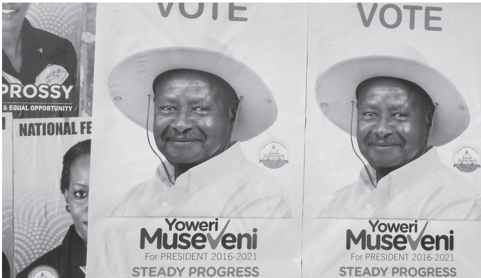
▲ Kép 3. Musevenit ábrázoló kampányplakátok. Forrás: theWorkZine. http://theworkzine.com/?p=184222

A hat ugandai körzetben végzett empirikus kutatásban egyértelműen pozitív tendencia figyelhető meg a helyi közösség női jelöltállítás, valamint a nők magas politikai pozíciókba történő integrációja kapcsán megjelenő attitűdök tekintetében. A vizsgálatok szerint a politikusok sokkal megbízhatóbbak, valamint a közösség érdekeivel is jobban törődnek, mint a férfi politikusok.