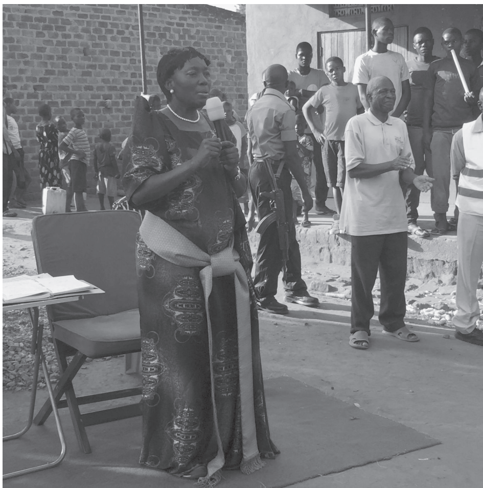
▲ Kép 2. Rebecca Kadaga, az ugandai parlament szóvivőjeként és Kamuli terület női képviselőjeként kampányol a 2016-os választások előtt.