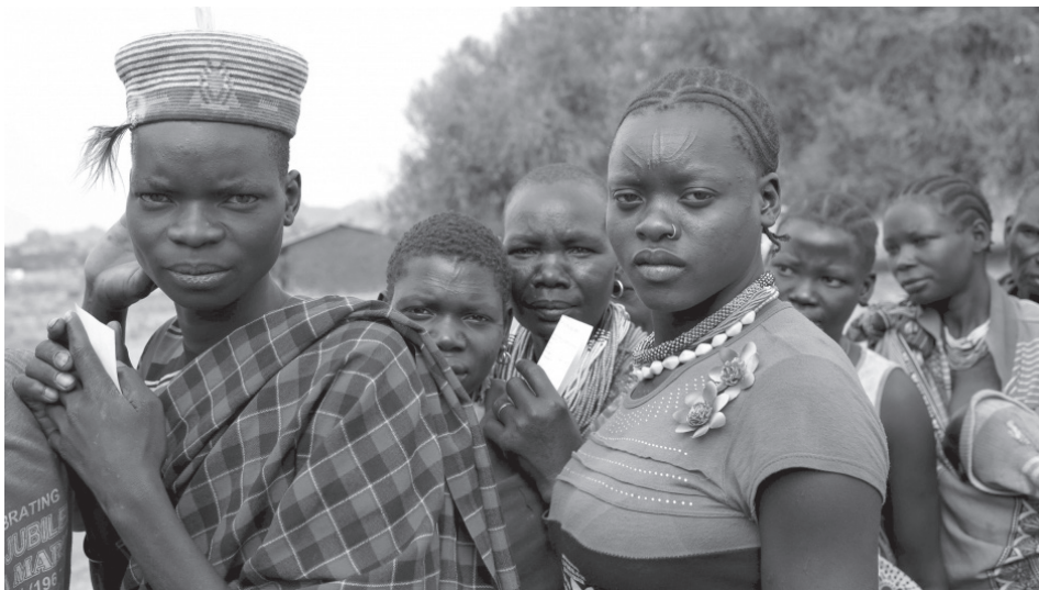
▲ Kép 1. Az észak-ugandai karimojong nevű törzs tagjai sorban állnak a szavazáshoz.