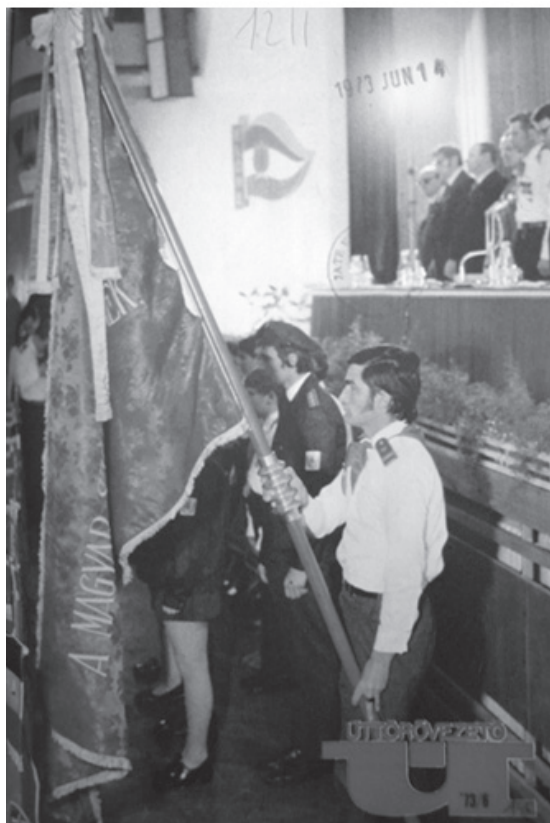
(Tiszteleg a vörös zászlónak az Úttörővezetők V. Országos Konferenciáján)

3. kép: Úttörővezető 1973. XXVII. évf. 6. sz. első külső borító