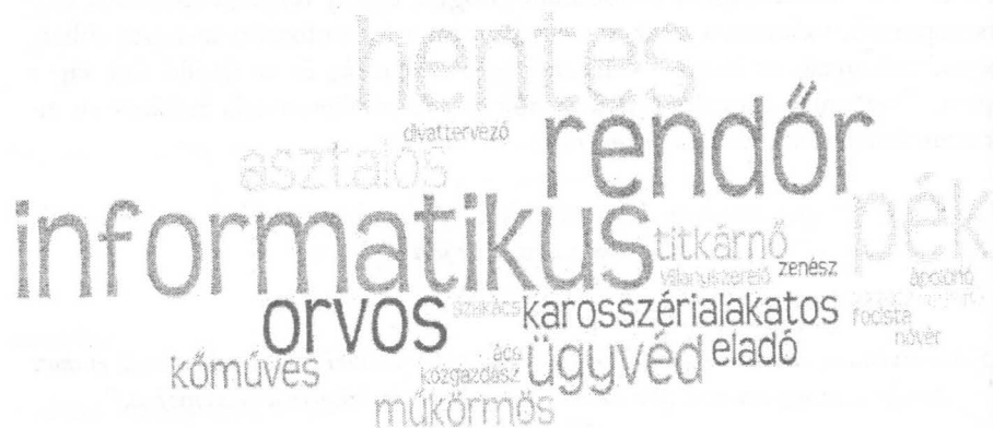
1. ábra: Az interjúalanyok által versenyképesnek tartott szakmák

Az ábra kitűnően rámutat arra, hogy leginkább az informatikai, rendőri, és hentesi pályát szánják gyermeküknek a kérdezettek. Többen említették még azt is, hogy pékként, orvosként, vagy asztalosként tudják elképzelni gyermekeiket. Úgy gondolom, a kérdésre vannak, akik reálisan, vannak, akik kevésbé reálisan, inkább az álmaik alapján válaszoltak. Óriási előrelépésnek tekinthető azonban, hogy a szülők mindenképpen azt szeretnék, hogy gyermekeik szakmát szerezzenek.